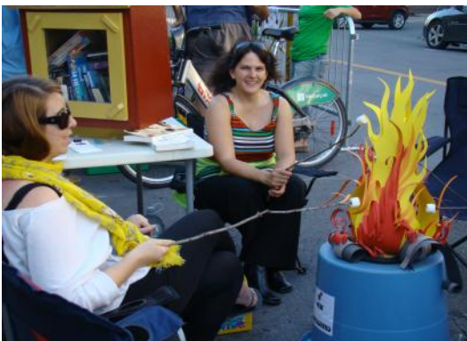
Comité priorité Culture de Rosemont

En collaboration avec l'Écoquartier et Tandem, trois comités de la démarche se sont retrouvés...dans la rue ! Et non, il ne s'agit pas d'une malheureuse recrudescence de l'itinérance dans le quartier mais plutôt d'une belle célébration lors de la journée « En ville sans ma voiture » qui a eu lieu le vendredi 20 septembre dernier. Ce fût une joyeuse rencontre festive , une occasion unique de se réapproprier l'espace public de façon ludique et rassembleuse. Les photos en témoignent ! On se donne un rendez-vous pour l'an prochain !