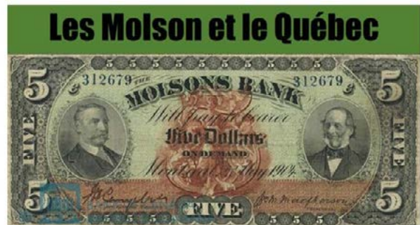
Molsons Bank, 5 dollars : 2 mai 1904. Code de Foliot : 1971.0115.00030.000