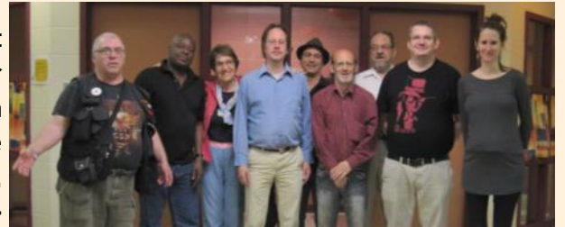
Bravo à tous les membres de la priorité Logement pour leur engagement au cours de la dernière année !

Le 13 juin dernier, les membres de la Priorité logement se sont retrouvés pour une dernière rencontre avant de se quitter pour une trêve estivale bien méritée. Nous avons profité de l'occasion pour revenir sur le succès de notre Assemblée publique sur le phénomène de gentrification dans Rosemont tenue le 25 mai 2016, évènement qui a rassemblé 90 personnes du quartier ! Enthousiasmés par cette première expérience, nous avons déjà commencé à envisager nos prochaines assemblées publiques prévues cet automne.